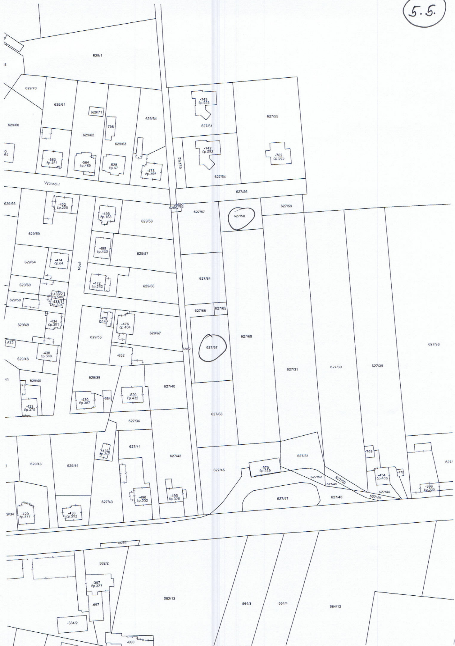
Měřitko 1 : 1452